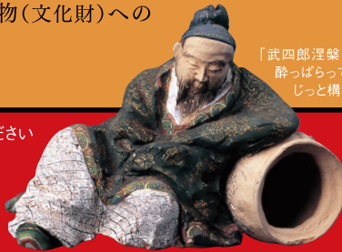
「妙楽菩薩塑像」明治10年(1877) 三浦乾也作、河鍋暁斎彩色 Ceramic doll "Myoraku" by Miura Kenya, Kawanabe Kyosai from the collection of the Matsuura Takeshiro Memorial Museum

日時: 4月21日(日) 14:00～15:30 会場: 明治安田ホール丸の内(明治安田生命ビル低層棟4F) 聴講無料・当日の入館券必要