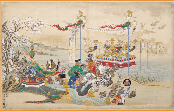
河鍋暁斎「地獄極楽めぐり図」明治2～5年(1869～72)当館蔵 会期中場面替えあり Traveling through hell and paradise, by Kawanabe Kyosai