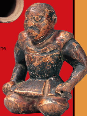
武者像 江戸後期(18C)当館蔵 Wooden doll warrior

非公開の文庫建物内部を学芸員が解説、岩崎家霊廟、庭園もご案内します。 日時: 4月30日(火)、5月10日(金)、いずれも10:30～、13:30～、15:30～ 定員: 各回20名 参加費: 1500円 要予約、本展入館券必要