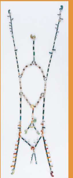
武四郎が身に着けている「大首飾り」に「火の用心」のタバコ入れ! 〈大首飾り〉縄文時代～近代 当館蔵 Necklace (Jomon Period with modern additions)

絵師・河鍋暁斎(1831～89)と、探検家で好古家、著述家、北海道の名付け親である松浦武四郎(1818～88)は、幕末から明治期を生きたマルチタレントです。二人の交流は明治の初め頃からあり、武四郎は愛玩品を集めた書物『撥雲余興』(当館蔵)等の挿絵を暁斎らに依頼しています。住いも近く、共に天神を信仰し、情に篤い二人をつなぐ記念碑的作品は何と言っても「武四郎涅槃図」です。本展では、「武四郎涅槃図」とそこに描かれた、「大首飾り」(当館所蔵)をはじめとした武四郎愛玩の品々(武四郎記念館所蔵品と当館所蔵品)を同じ空間で展示し、「武四郎涅槃図」を立体的に再現します。さらに、武四郎の親友・川喜田石水(1822～79/川喜田家第14代)と実業家で陶芸も能くした川喜田半泥子(1878～1963/川喜田家第16代)、岩崎小彌太(1879～1945/三菱第四代社長・静嘉堂初代理事長)との縁を紹介します。幕末明治の多才な二人と、彼らを支えた人々の、古物(文化財)への情熱に思いを馳せる機会となれば幸いです。