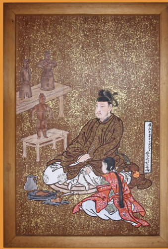
野見宿禰は埴輪を作り土師臣に。土師氏の末裔が天神様!! 河鍋暁斎「野見宿禰」松浦武四郎記念館蔵 Norino Sukune, by Kawanabe Kyosai From the collection of the Matsuura Takeshiro Memorial Museum

絵師・河鍋暁斎(1831～89)と、探検家で好古家、著述家、北海道の名付け親である松浦武四郎(1818～88)は、幕末から明治期を生きたマルチタレントです。二人の交流は明治の初め頃からあり、武四郎は愛玩品を集めた書物『撥雲余興』(当館蔵)等の挿絵を暁斎らに依頼しています。住いも近く、共に天神を信仰し、情に篤い二人をつなぐ記念碑的作品は何と言っても「武四郎涅槃図」です。本展では、「武四郎涅槃図」とそこに描かれた、「大首飾り」(当館所蔵)をはじめとした武四郎愛玩の品々(武四郎記念館所蔵品と当館所蔵品)を同じ空間で展示し、「武四郎涅槃図」を立体的に再現します。さらに、武四郎の親友・川喜田石水(1822～79/川喜田家第14代)と実業家で陶芸も能くした川喜田半泥子(1878～1963/川喜田家第16代)、岩崎小彌太(1879～1945/三菱第四代社長・静嘉堂初代理事長)との縁を紹介します。幕末明治の多才な二人と、彼らを支えた人々の、古物(文化財)への情熱に思いを馳せる機会となれば幸いです。